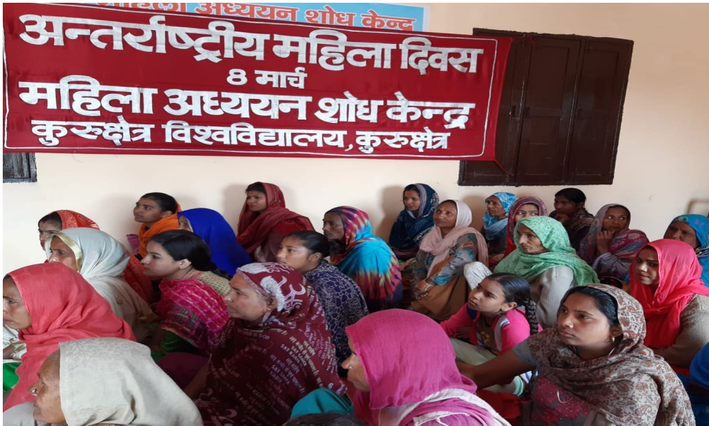
Awareness camp in Village Palwal, Kurukshetra