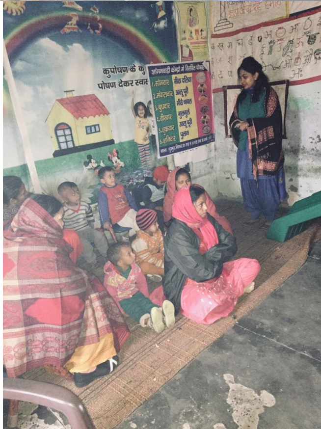
Awareness camp in Karan Colony, Kurukshetra